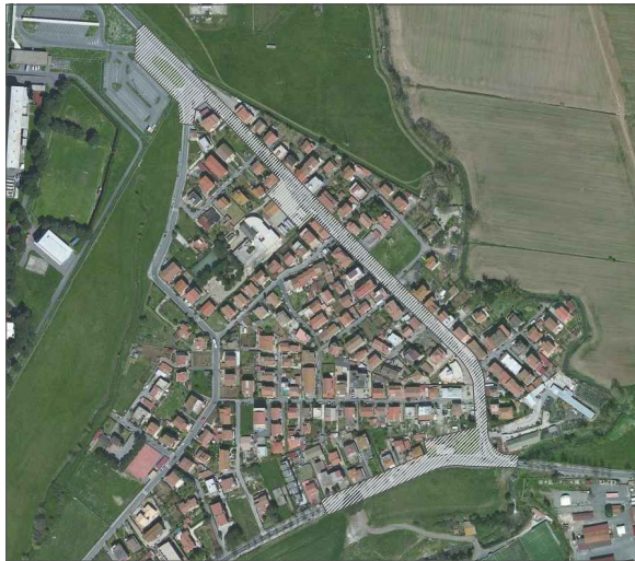
PARTE DEL RILIEVO DA INSERIRE SU BASE CATASTALE SCALA 1:2000 PUNTO B e C DELL'AVVISO PUBBLICO