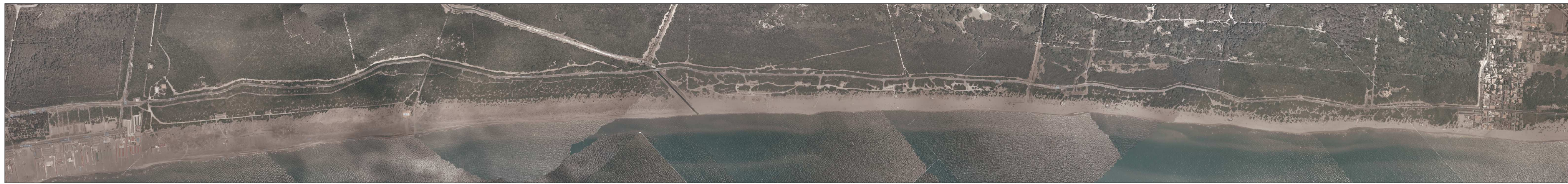
OSTIA LEVANTE - CASTELPORZIANO E CAPOCOTTA SU FOTO AEREA