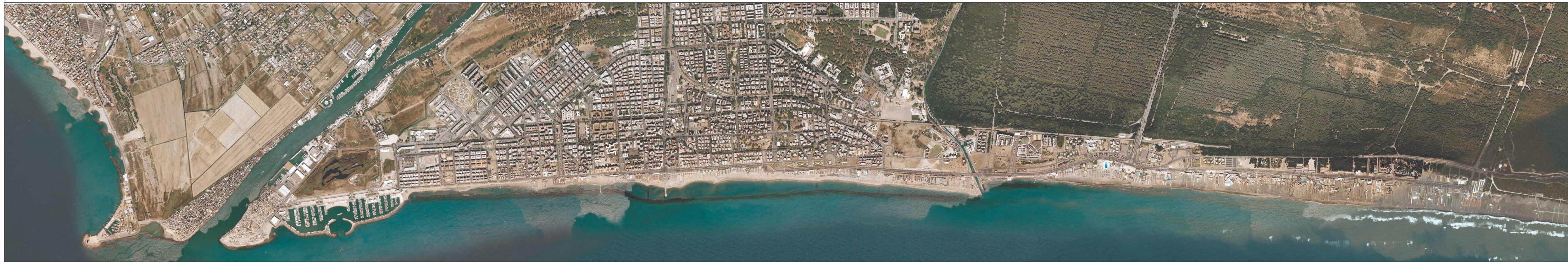
OSTIA PONENTE E CENTRO SU FOTO AEREA