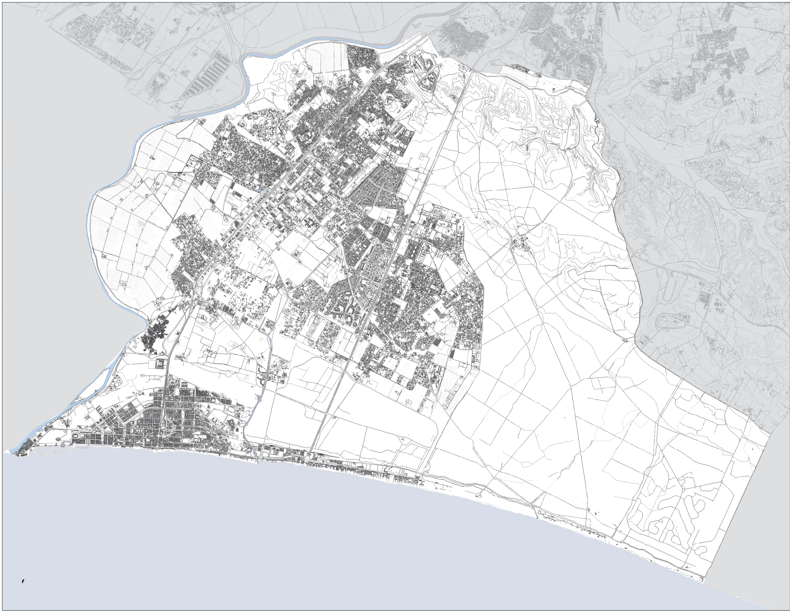
INQUADRAMENTO MUNICIPIO ROMA X SU BASE CARTOGRAFICA CTRN LAZIO