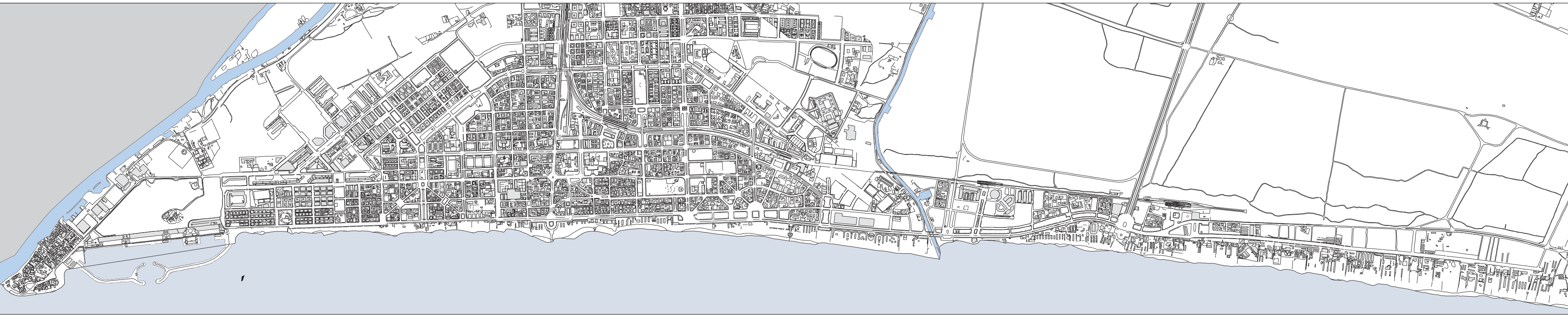
OSTIA PONENTE E CENTRO SU BASE CARTOGRAFICA CTRN LAZIO