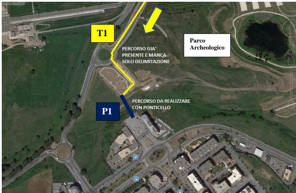
Figura 1 Percorso Stazione Nuova Ponte di Nona - Via Caltagirone

violetti, la segnaletica verticale ed i cartelli indicanti la stazione dalla parte Ovest del quartiere.