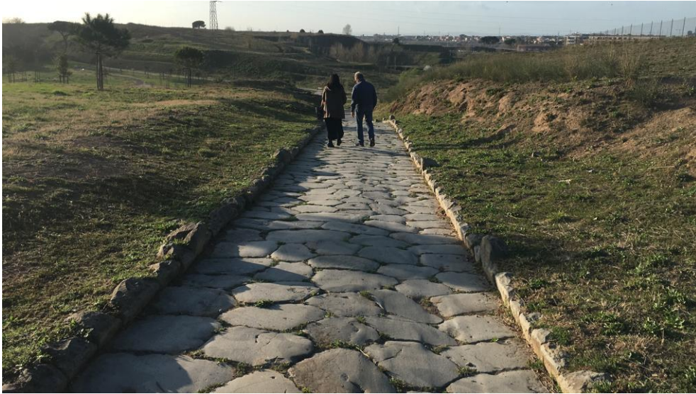
Figura 6 Tracciato Antica Via Collatina presso il Parco Archeologico

Tra i benefici annoverabili si evidenzia, infine, come questo possa essere inserito in un più ampio progetto denominato “ Parco Lineare Roma Est ” (attualmente in fase di discussione ed elaborazione) che si propone di unire Porta Maggiore all’area archeologica di GABII, a pochi passi da Roma, mediante un percorso ciclo-pedonale che prevede anche il passaggio per il quartiere Nuova Ponte di Nona.