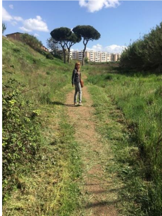
Figura 4 Area incolta T1 dove sarebbero previsti i vialetti

Anche il sottopasso di via L. CONTI (TU), oggi pieno di piante infestanti, andrebbe illuminato e attrezzato con nuovi vialetti, stimati, con costi di realizzazione di circa € 50,00 per mq. Tale percorso, snodandosi, per esempio, in direzione di Via Prenestina, passerebbe accanto alle suggestive strutture pubbliche presenti nel quartiere: La Chiesa Santa Teresa di Calcutta, la Soprintendenza dei Beni Culturali e la Biblioteca Casale Rosso.