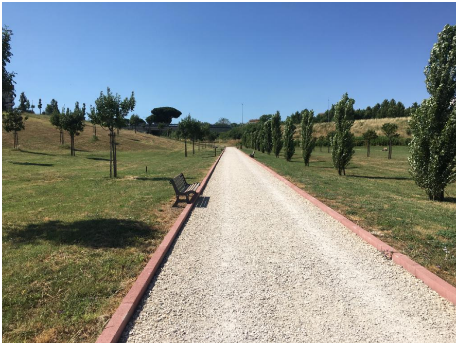
Figura 3 I vialetti del Parco Archeologico che si vorrebbero replicare