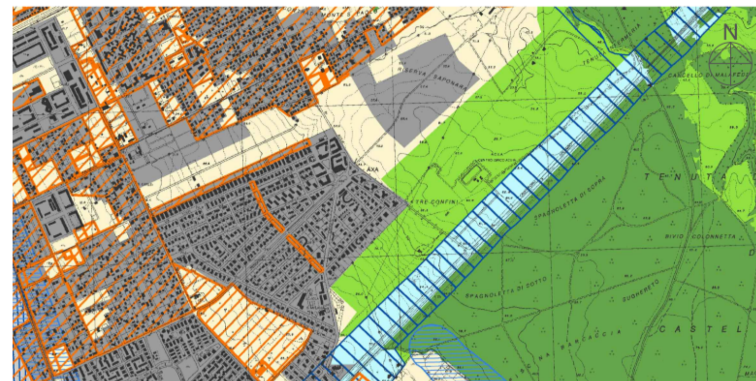
PTPR - PIANO TERRITORIALE PAESISTICO REGIONALE TAVOLA A FOGLIO 29 - SCALA 1:25.000