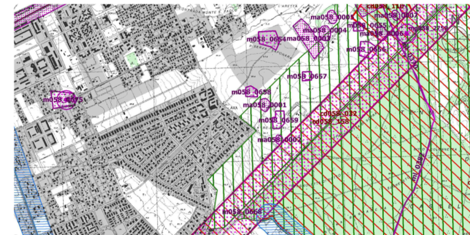
PTPR - PIANO TERRITORIALE PAESISTICO REGIONALE TAVOLA B FOGLIO 29 - SCALA 1:25.000