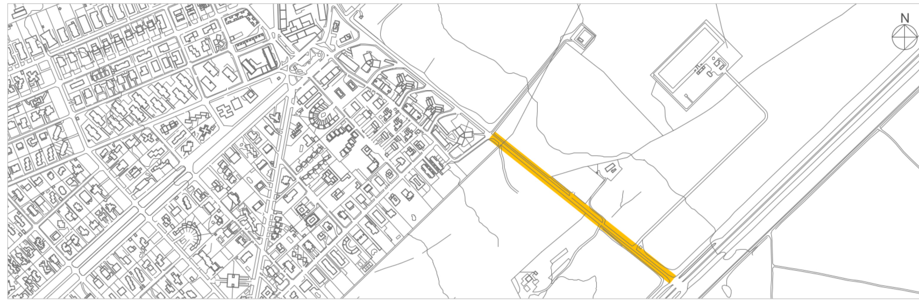
INDIVIDUAZIONE DEI TRATTI PLANIMETRIA - SCALA 1:5.000