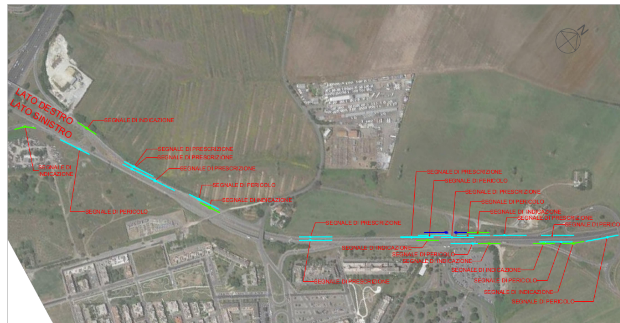
VINCOLI PLANIMETRIA - SCALA 1:5.000

VIA BELMONTE IN SABINA DAL KM 0+000 (SEGNALE FINE AUTOSTRADA SVINCOLO GRA) AL KM 1+400