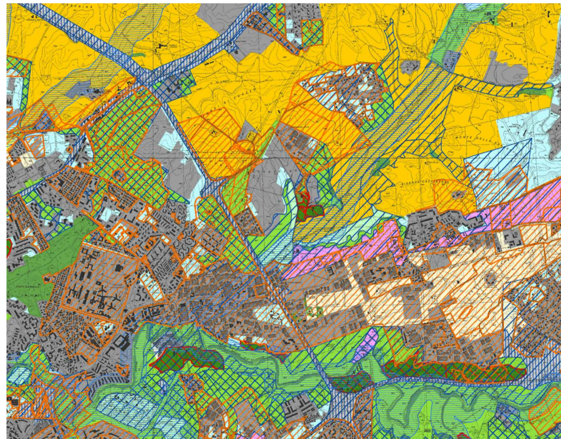
PTPR - PIANO TERRITORIALE PAESISTICO REGIONALE TAVOLA A FOGLIO 24 - SCALA 1:25.000