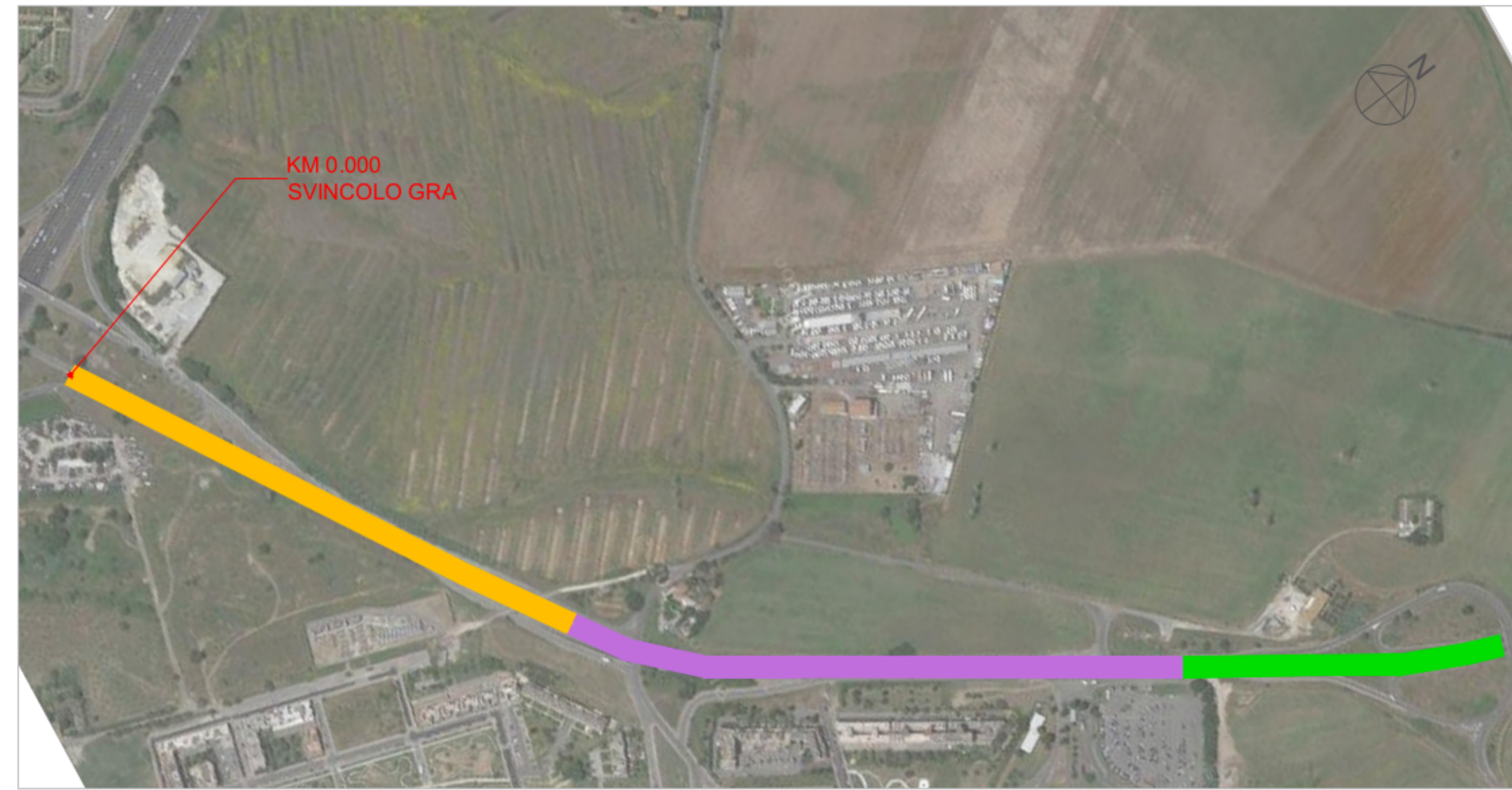
INDIVIDUAZIONE DEI TRATTI PLANIMETRIA - SCALA 1:5.000