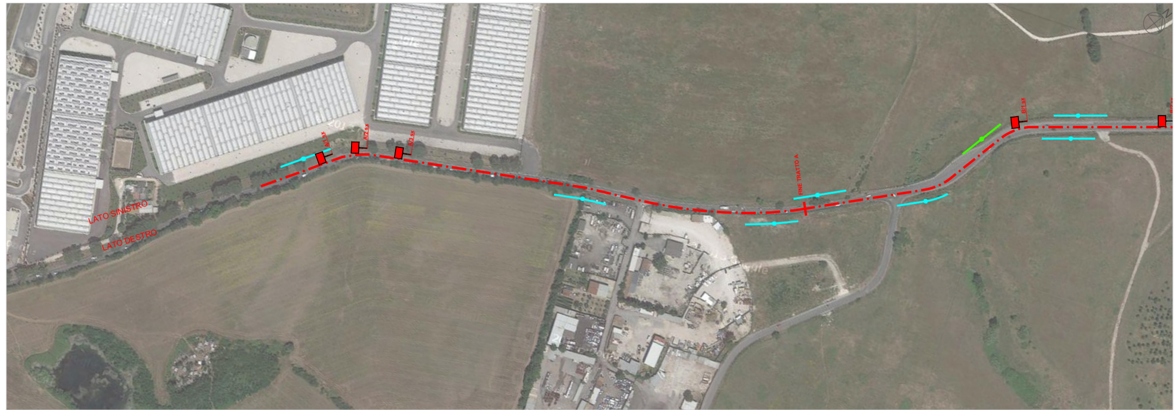
LOCALIZZAZIONE DEGLI IMPIANTI PUBBLICITARI PLANIMETRIA - SCALA 1:2.000