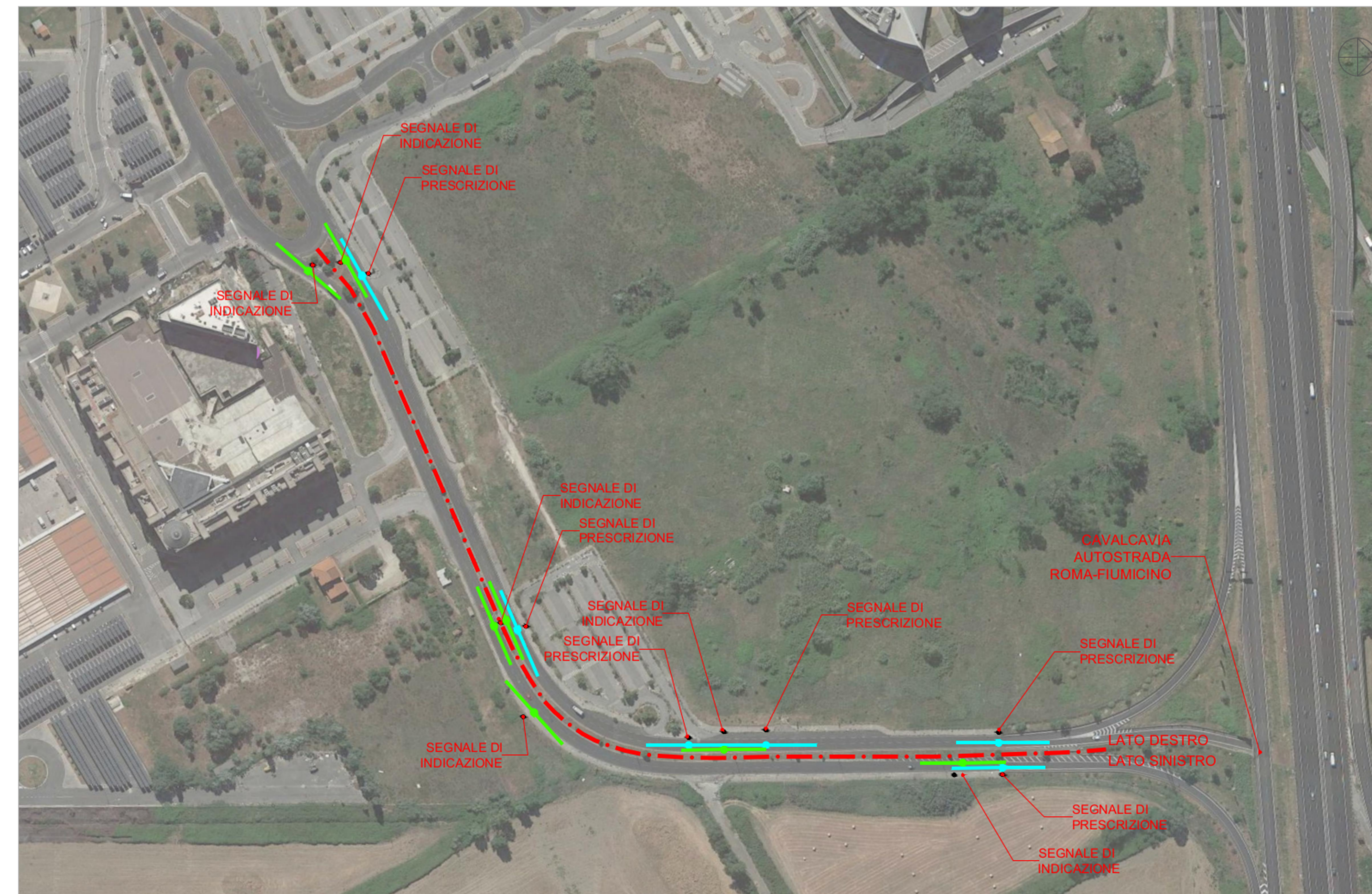
VINCOLI - TRATTO A PLANIMETRIA - SCALA 1:2.000