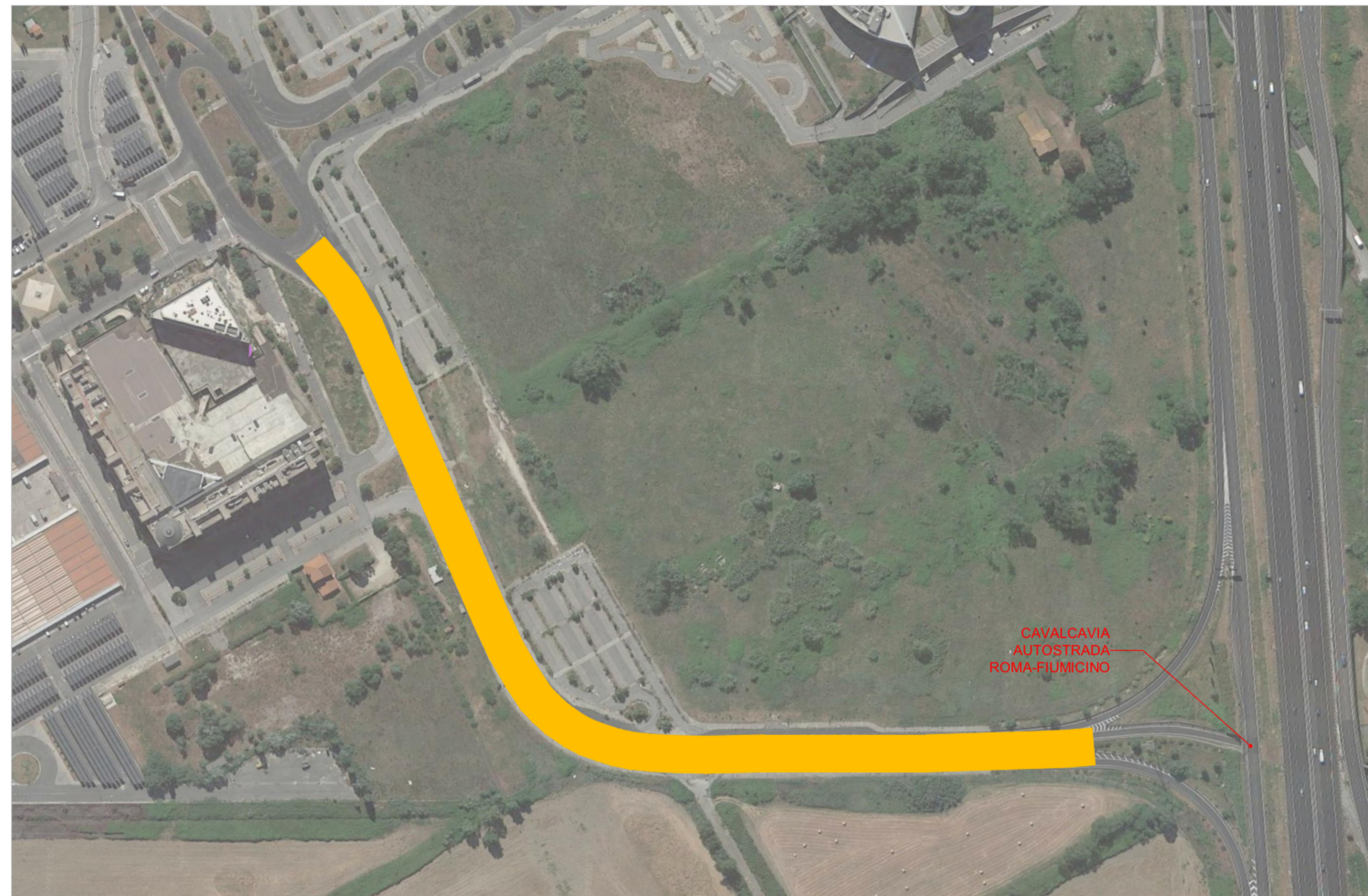
INDIVIDUAZIONE DEI TRATTI PLANIMETRIA - SCALA 1:2.000