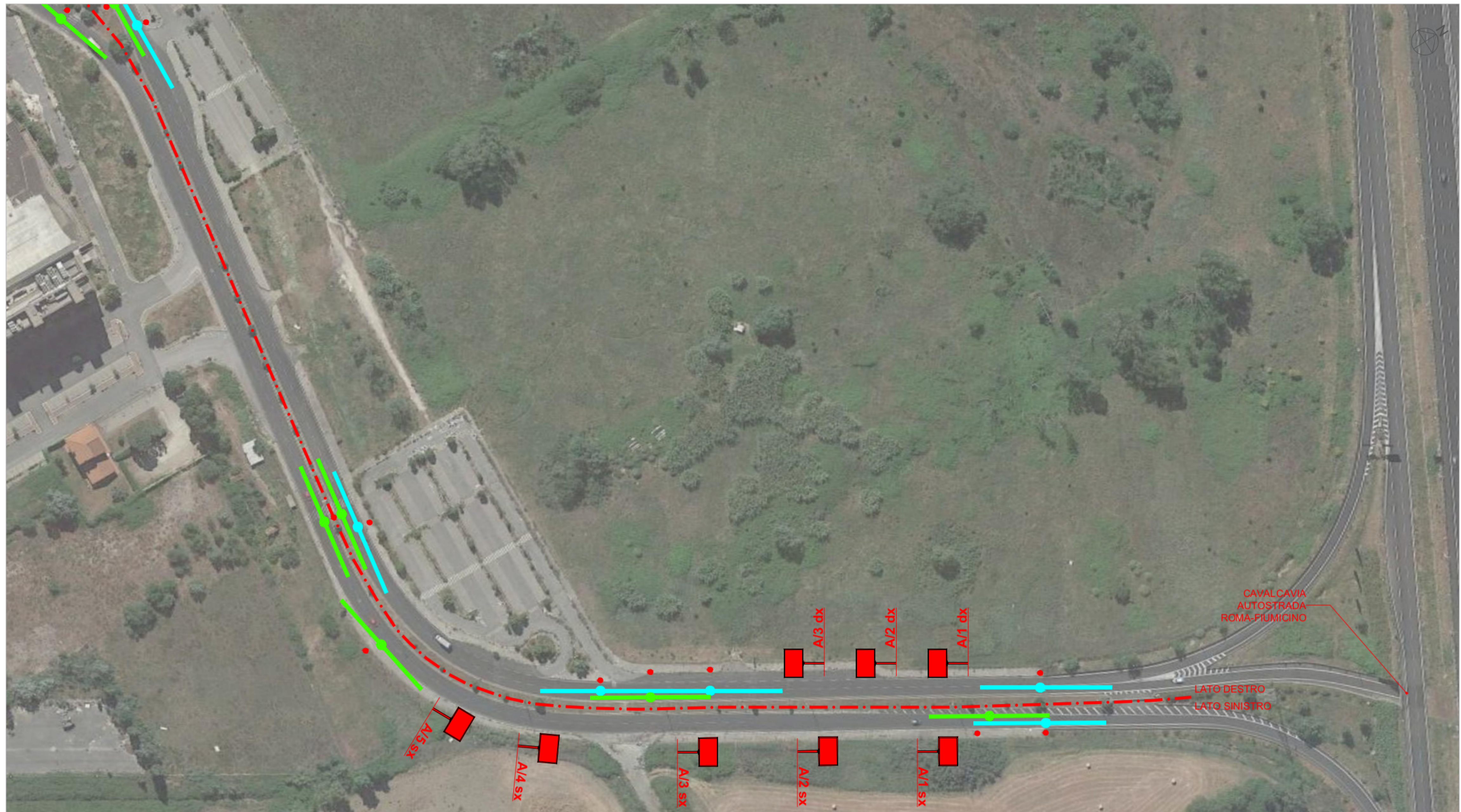
LOCALIZZAZIONE DEGLI IMPIANTI PUBBLICITARI PLANIMETRIA - SCALA 1:1.000