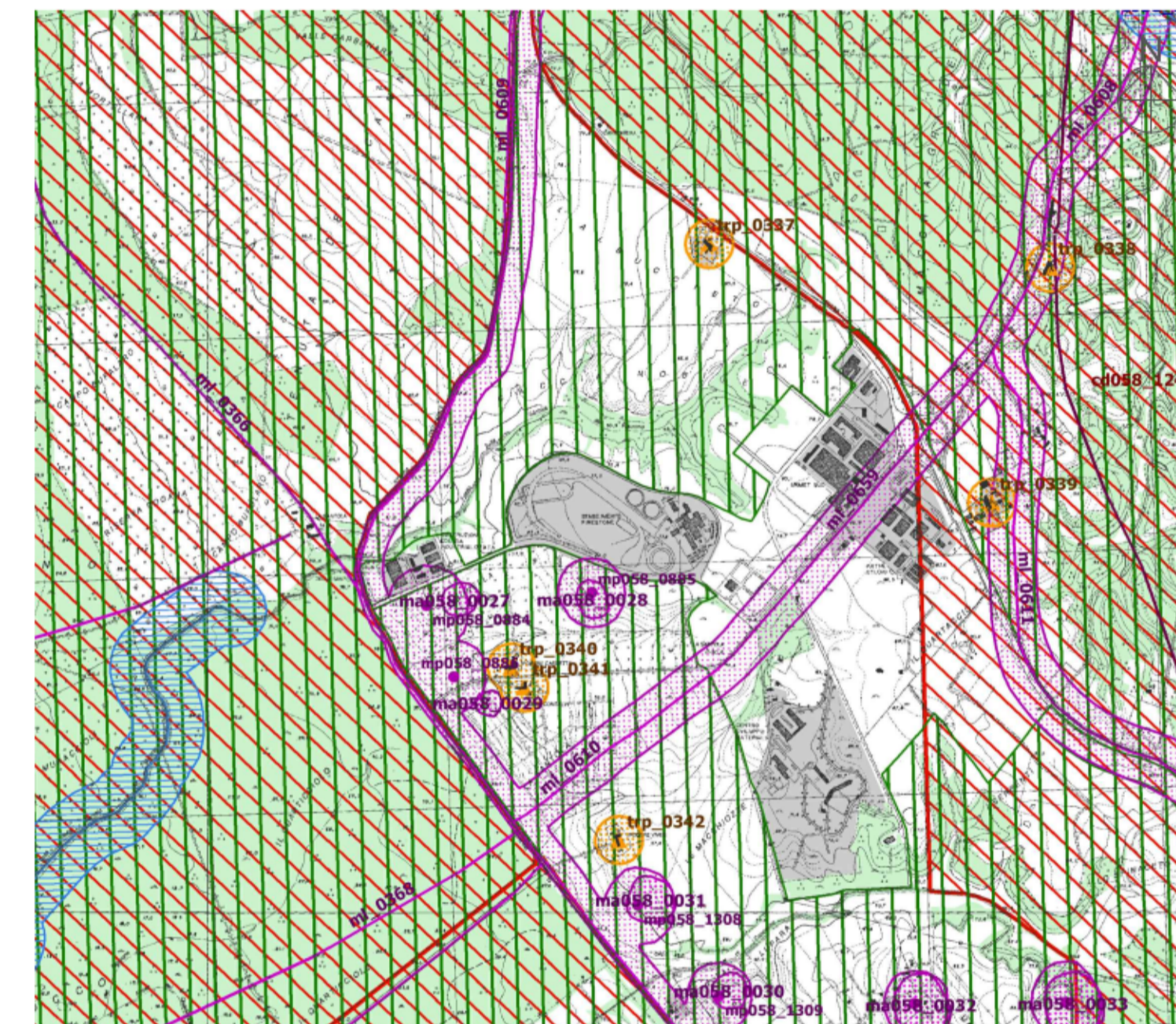
PTPR - PIANO TERRITORIALE PAESISTICO REGIONALE TAVOLA B FOGLIO 29 - SCALA 1:25.000