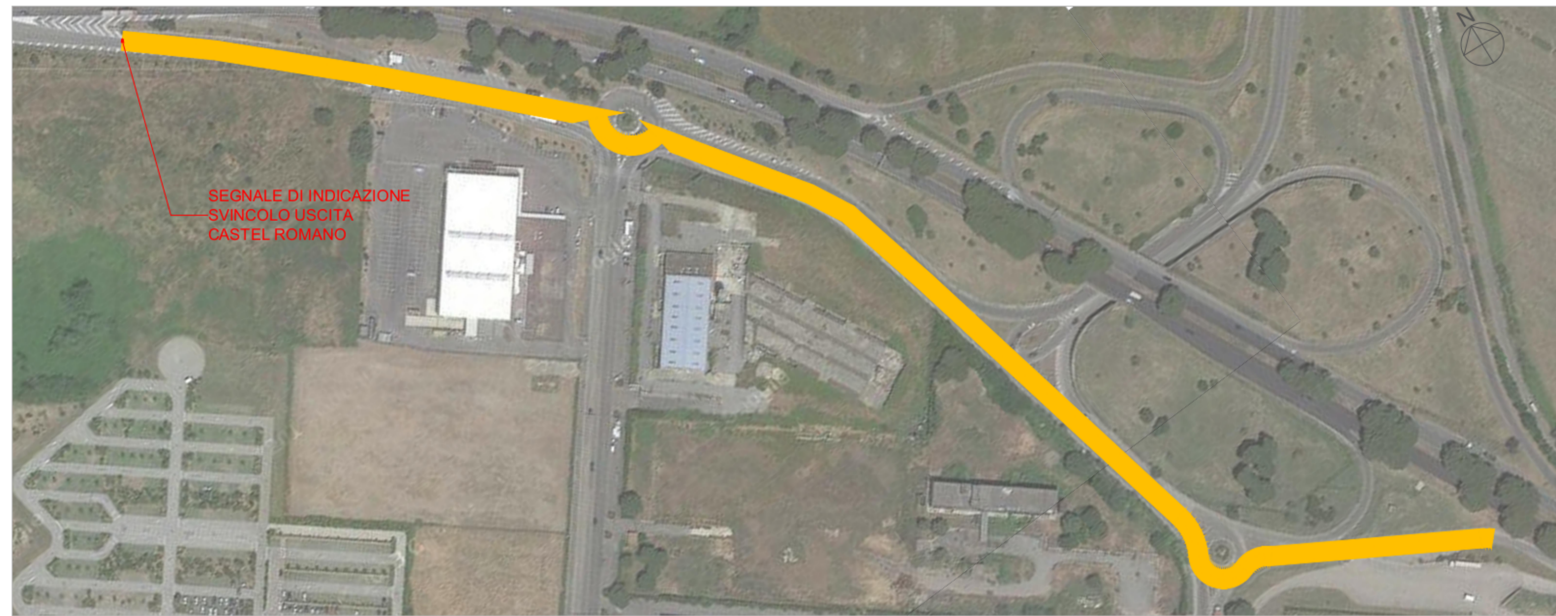
INDIVIDUAZIONE DEI TRATTI PLANIMETRIA - SCALA 1:2.000