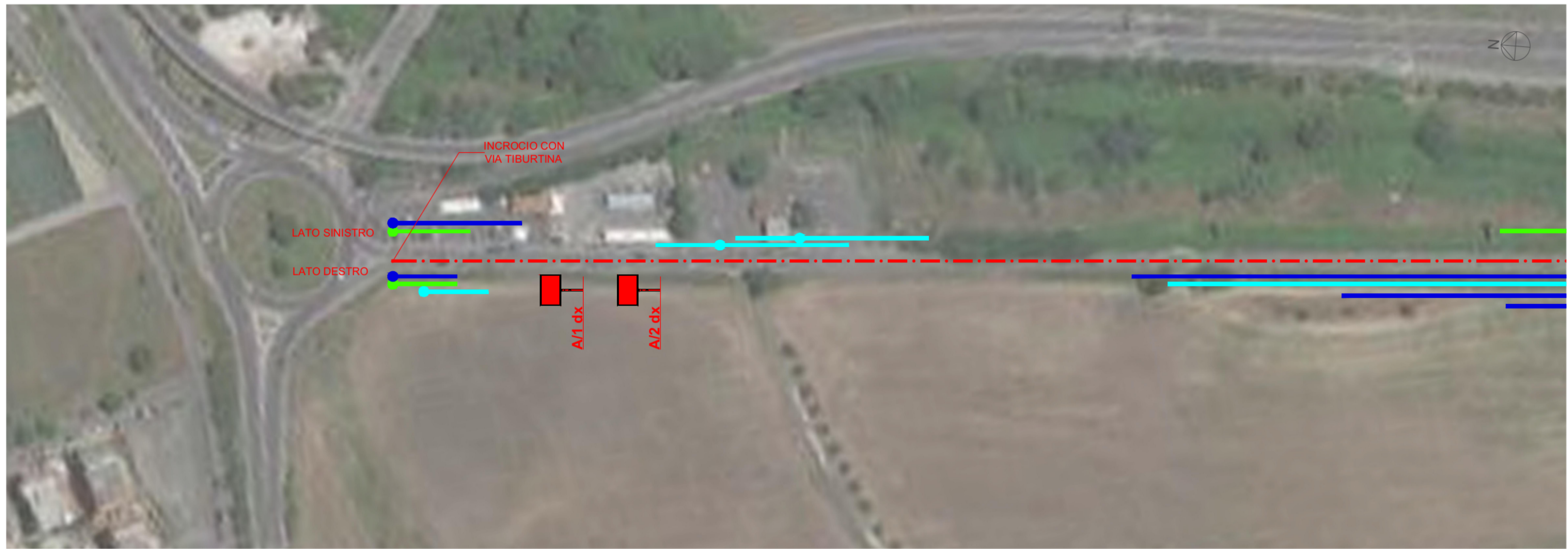
LOCALIZZAZIONE DEGLI IMPIANTI PUBBLICITARI PLANIMETRIA - SCALA 1:1.000