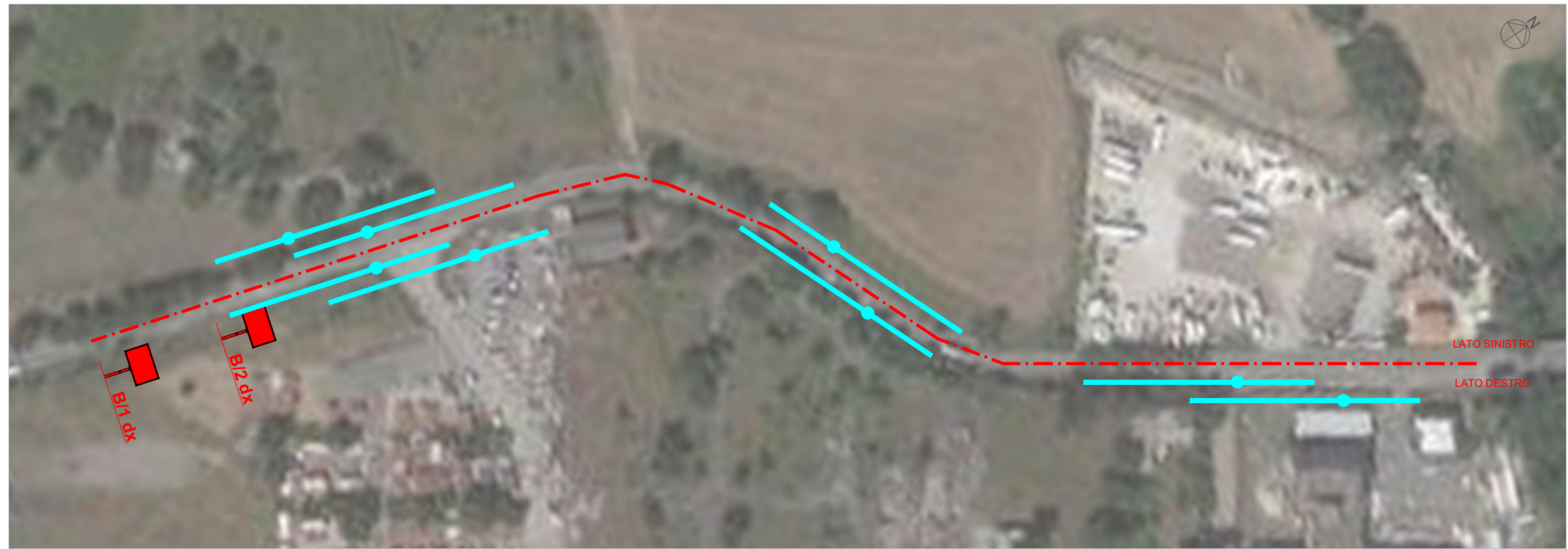
LOCALIZZAZIONE DEGLI IMPIANTI PUBBLICITARI PLANIMETRIA - SCALA 1:1.000