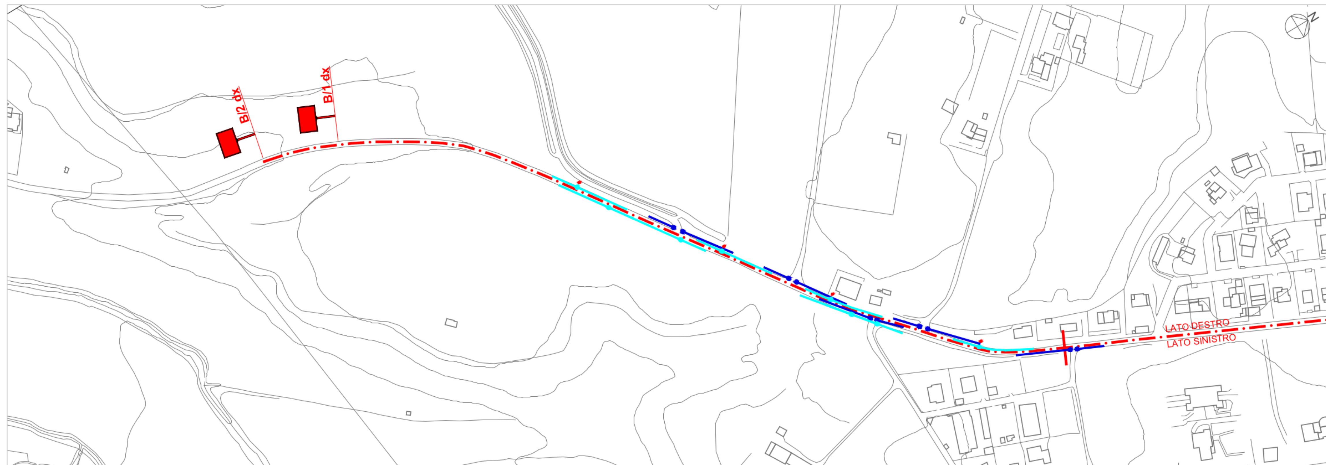
LOCALIZZAZIONE DEGLI IMPIANTI PUBBLICITARI PLANIMETRIA - SCALA 1:2.000