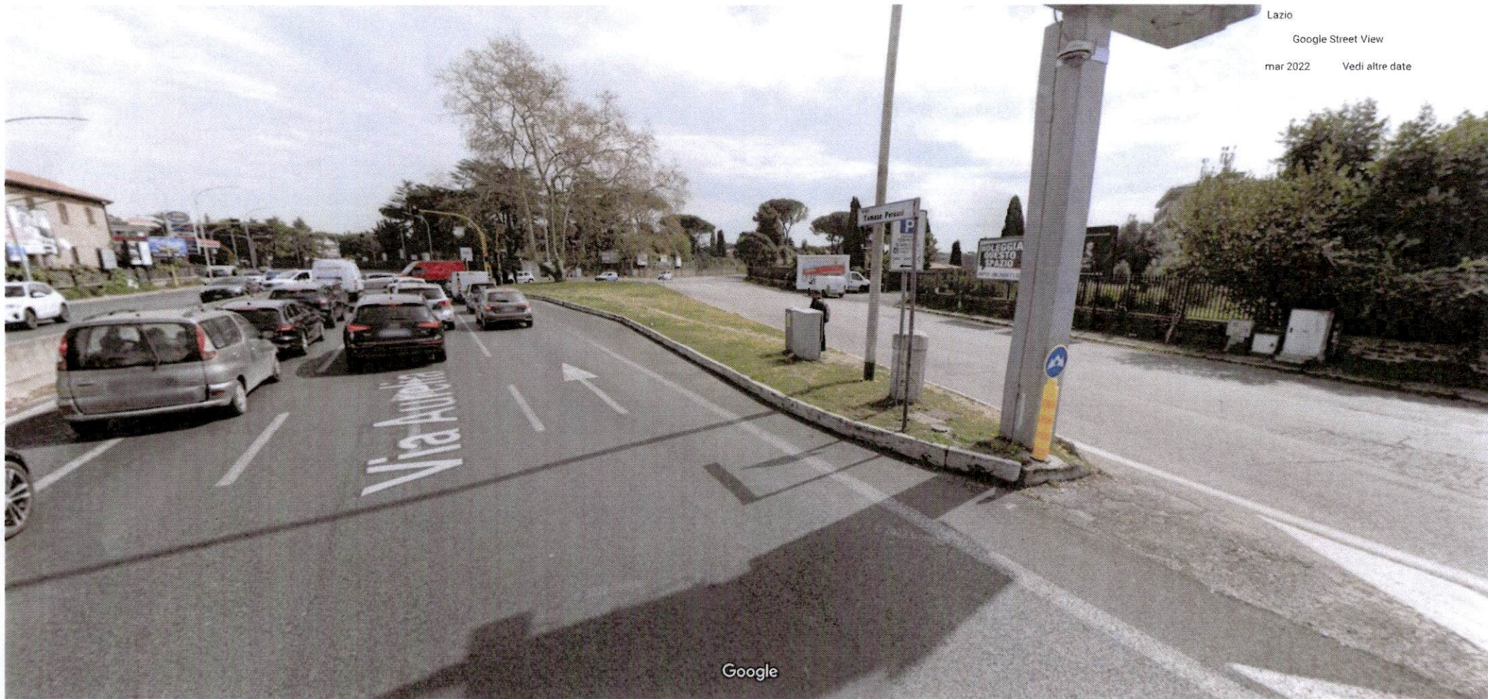
Data dell'immagine: mar 2022