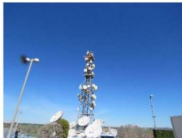
Foto n.1- Vista della SRB