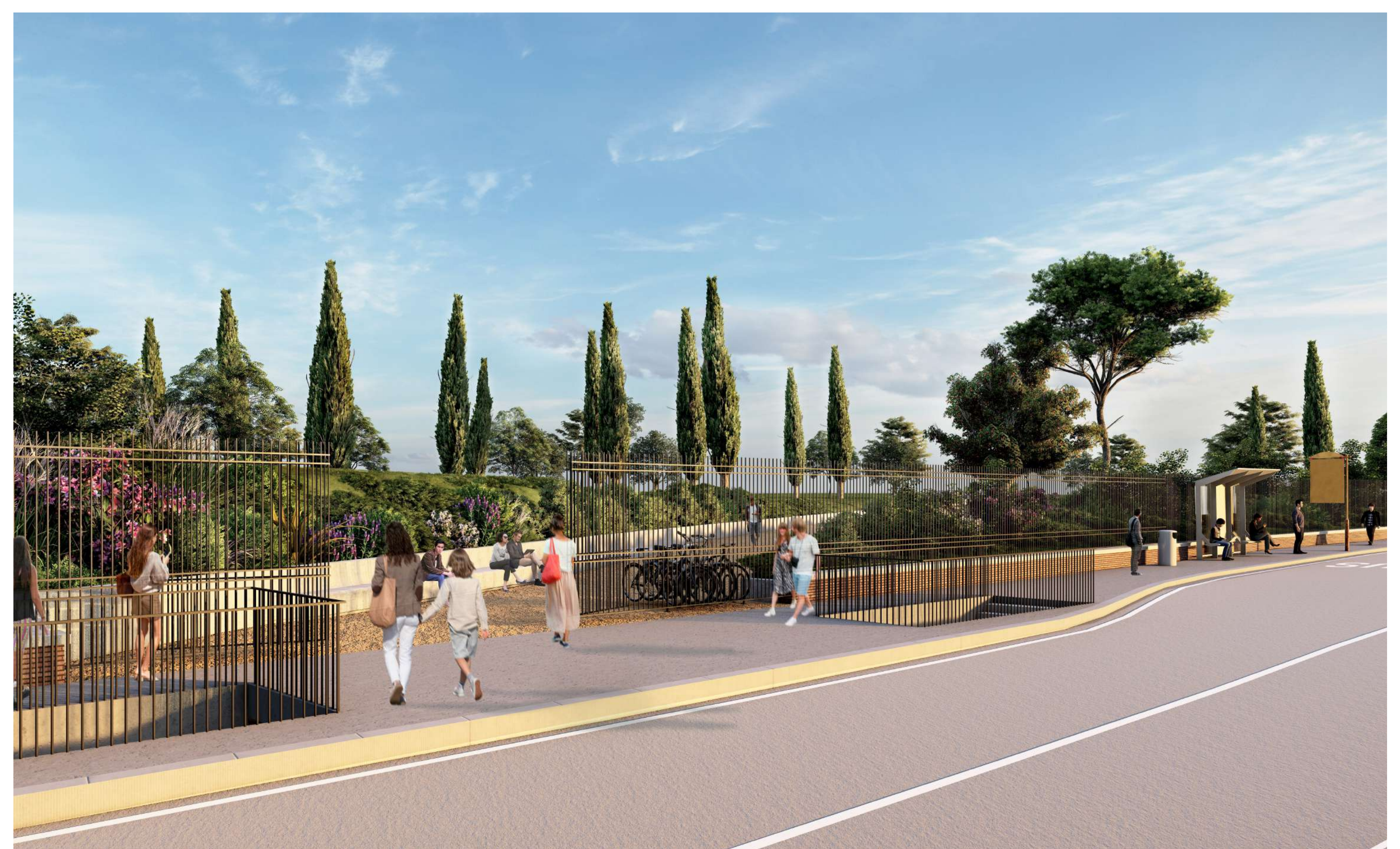
Vista dell'ingresso da via Casilina