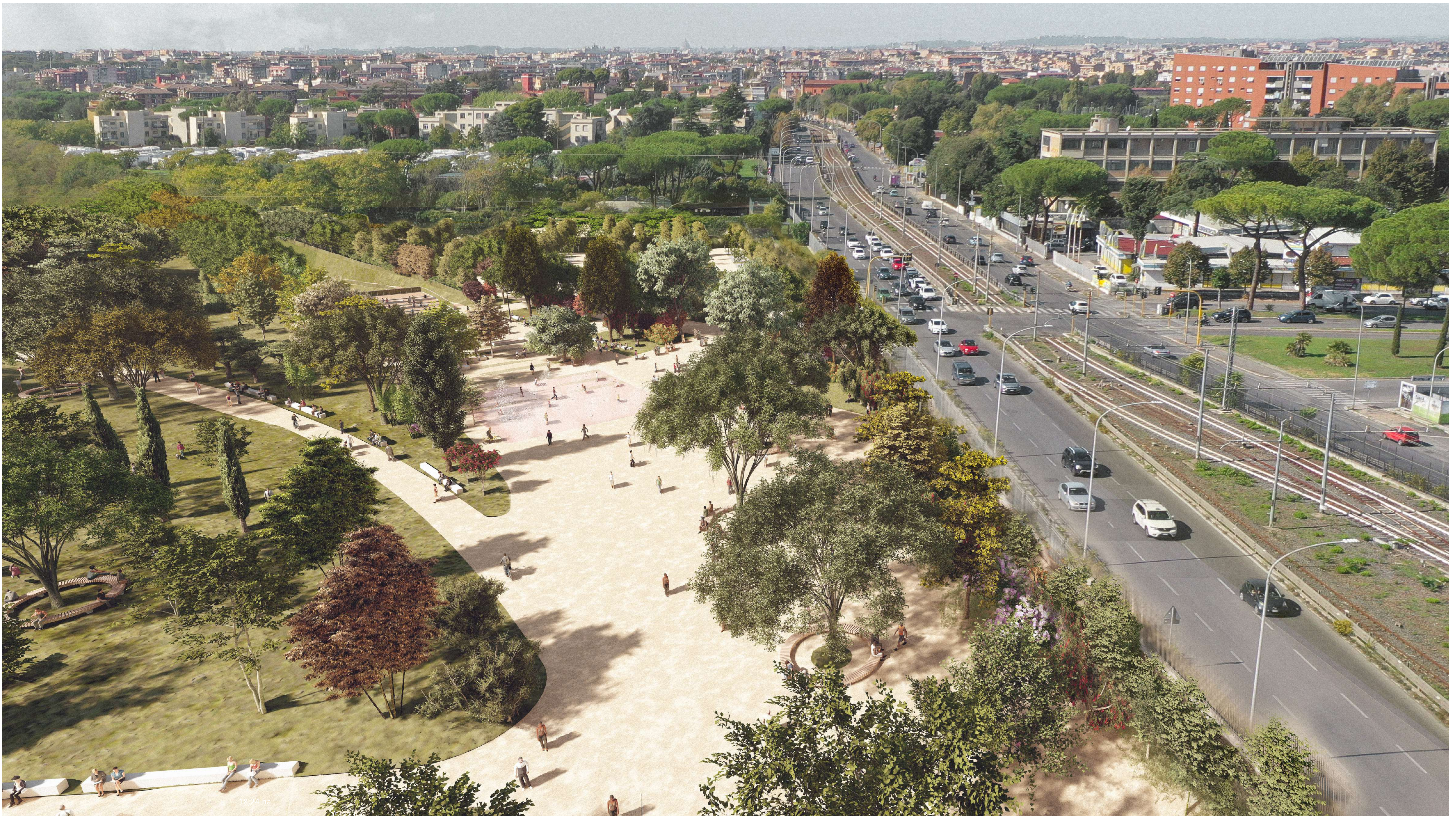
Vista della piazza del Parco