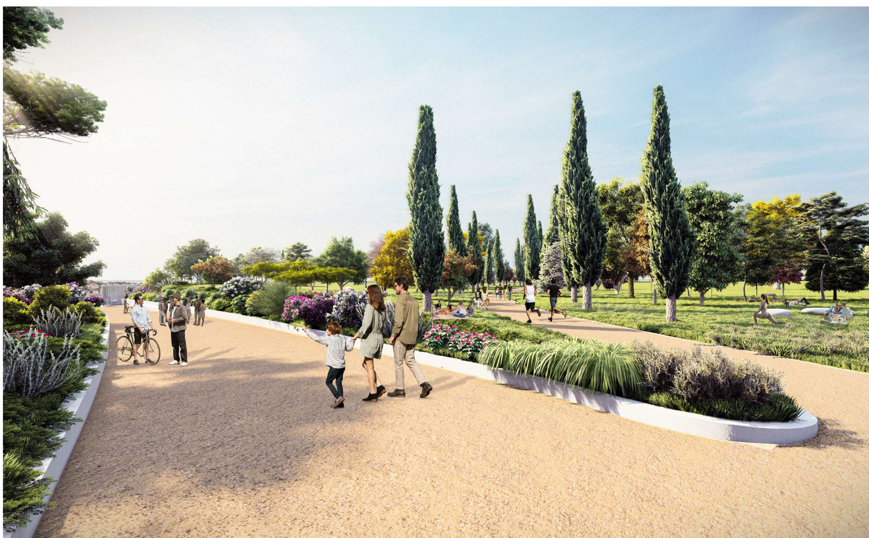
Vista della rampa d'accesso al parco da Via Casilina