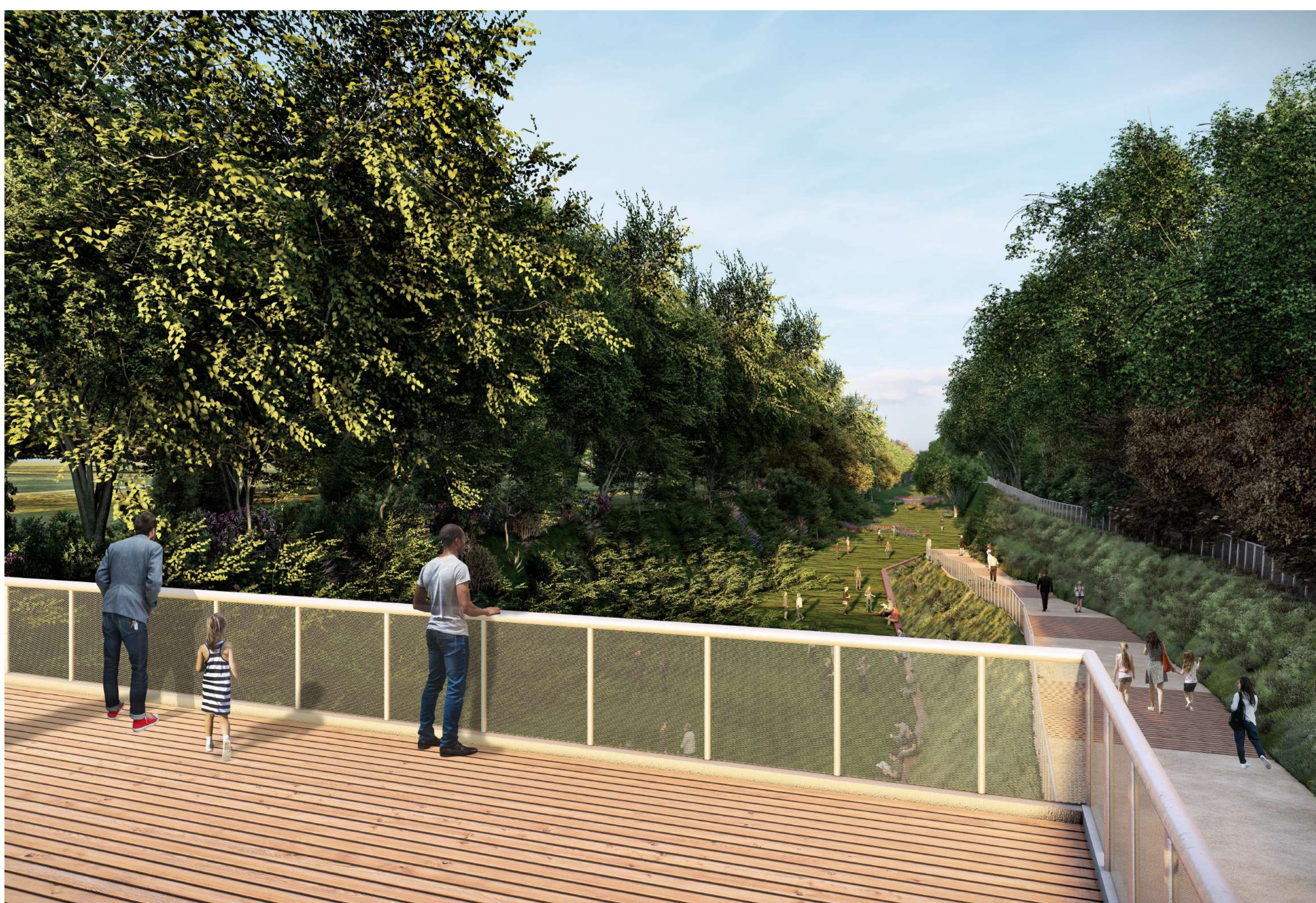
Vista sulla tagliata

La tagliata ferroviaria abbandonata rappresenta un luogo dove la natura ha preso il sopravvento, un sistema di notevole valore in termini di biodiversità; un “monumento naturale” che può essere recuperato e riqualificato con la possibilità di inserire nuovi impianti vegetali e rappresentare un altro luogo significativo del Parco.