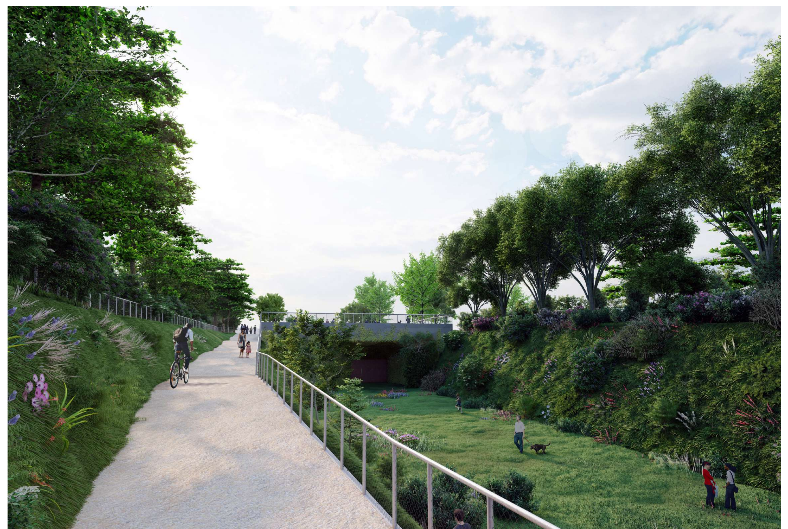
Vista della promenade