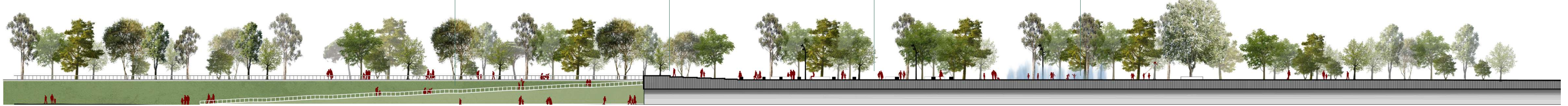
Sezione Promenade di Centocelle