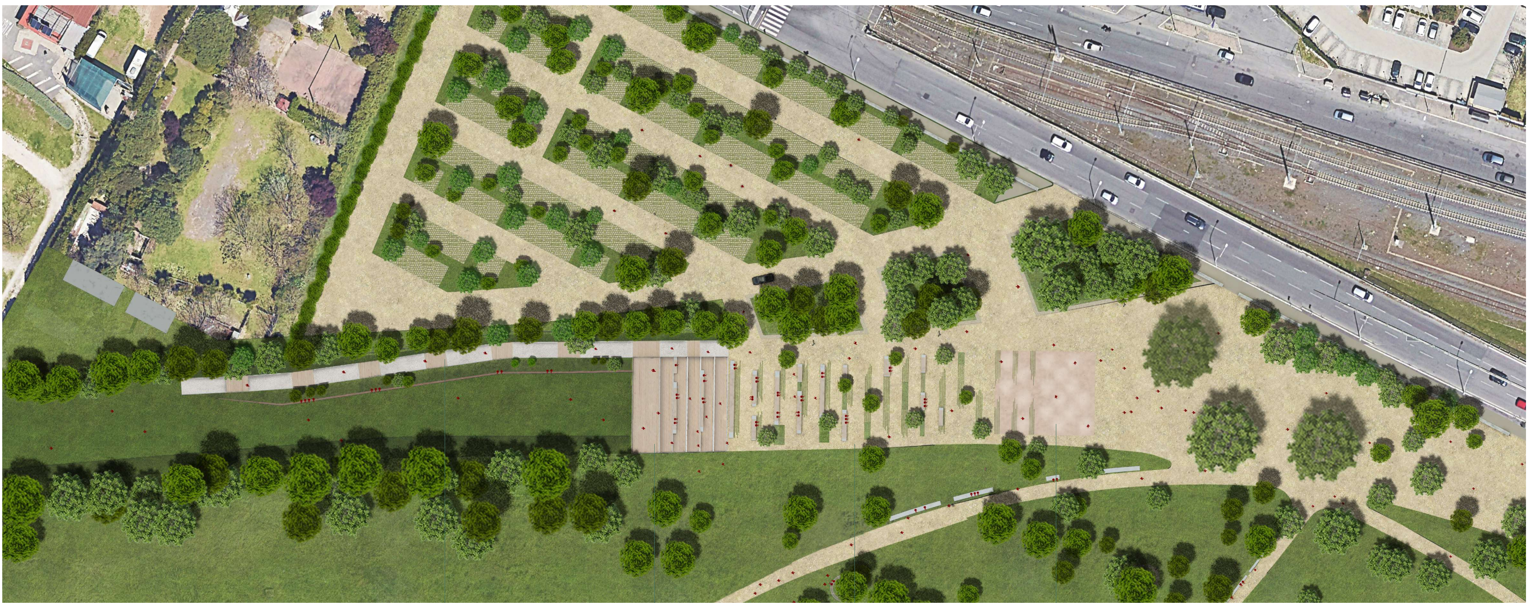
Planimetria Promenade di Centocelle