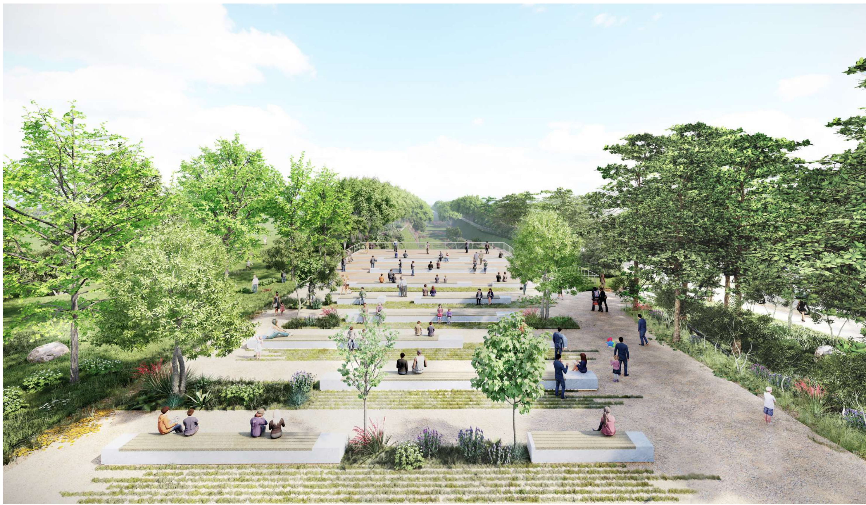
Piazza del Parco – affaccio sulla “tagliata ferroviaria”