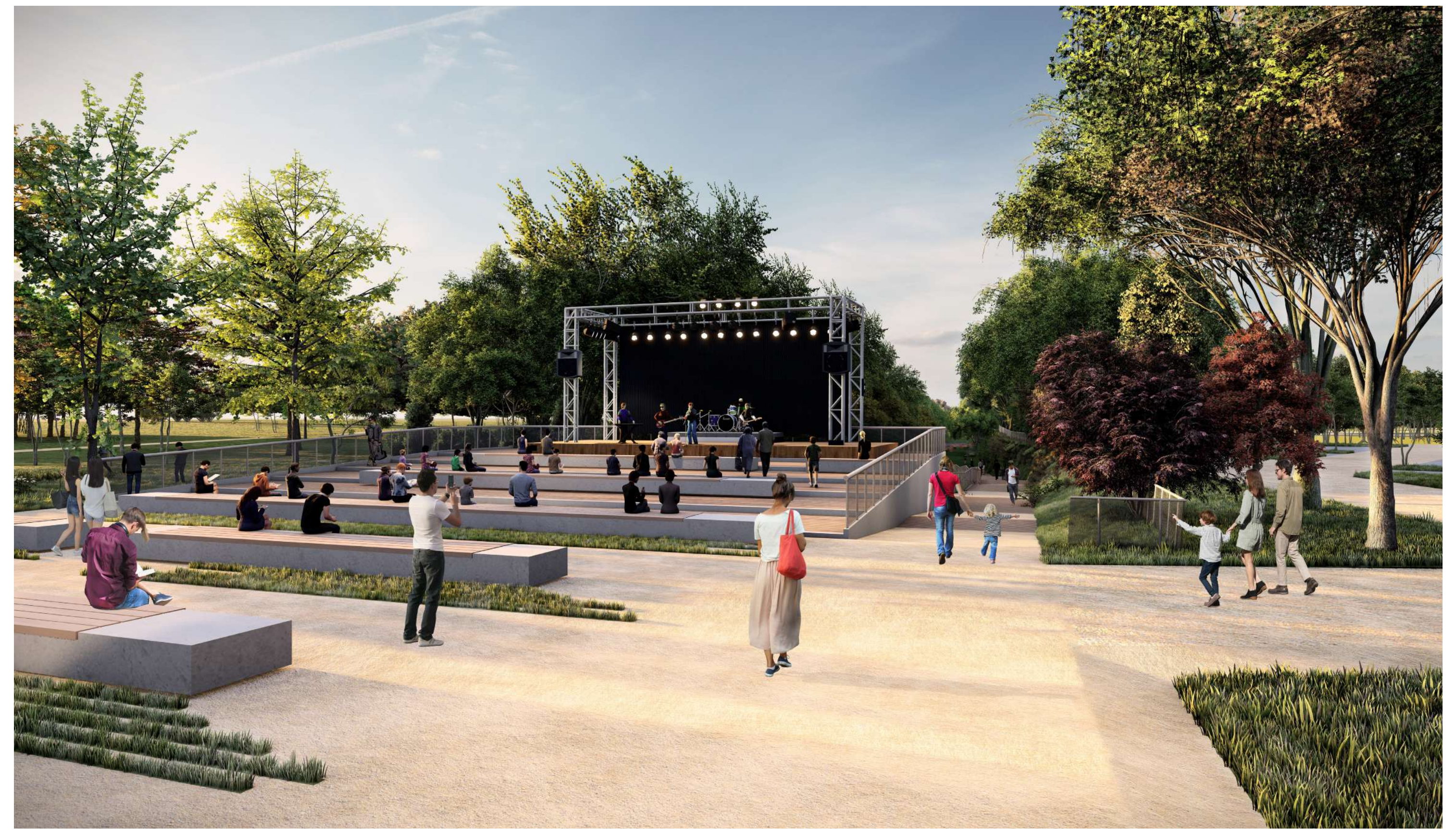
Piazza del Parco – palco polivalente