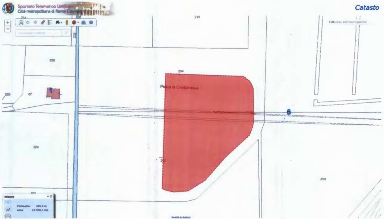
Foglio 129 particelle 292p e 294p