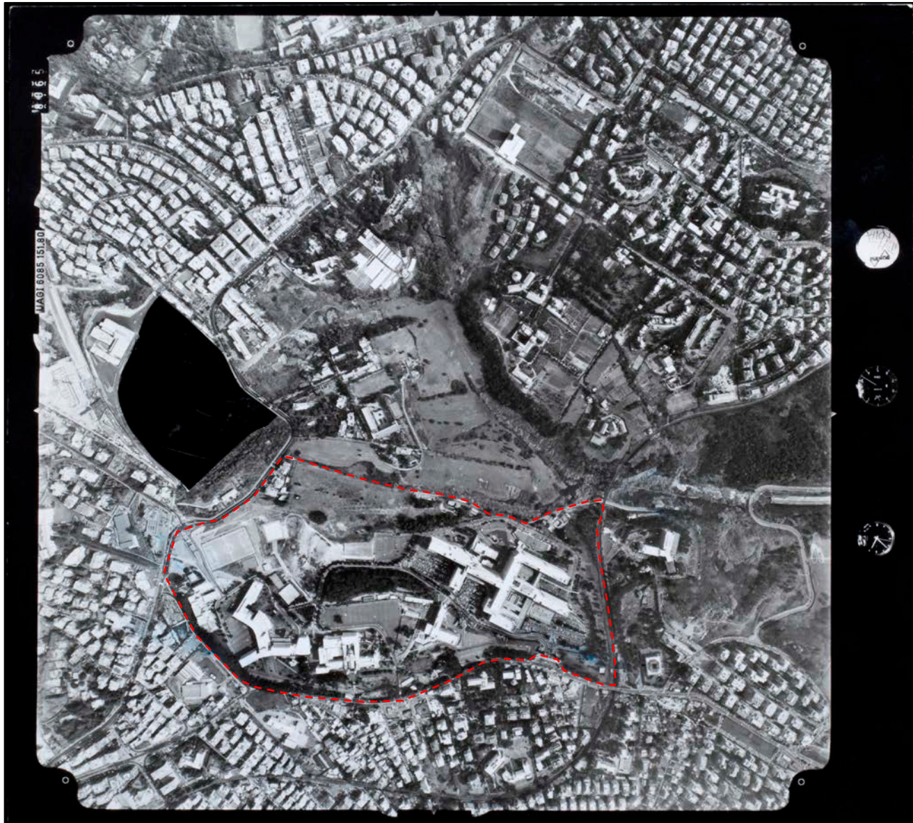
Il campus Universitario in una immagine di Sara Nistri anno 1992.