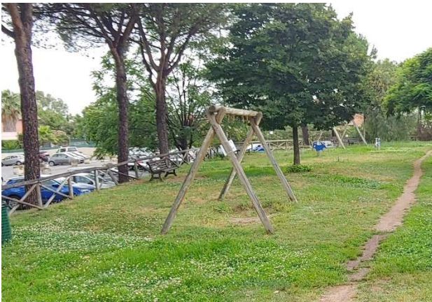
Area ludica ante-operam