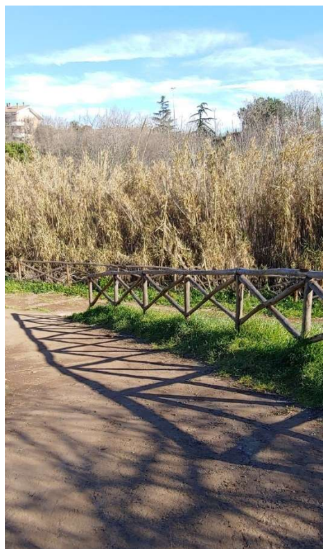
Staccionata a croce post-operam