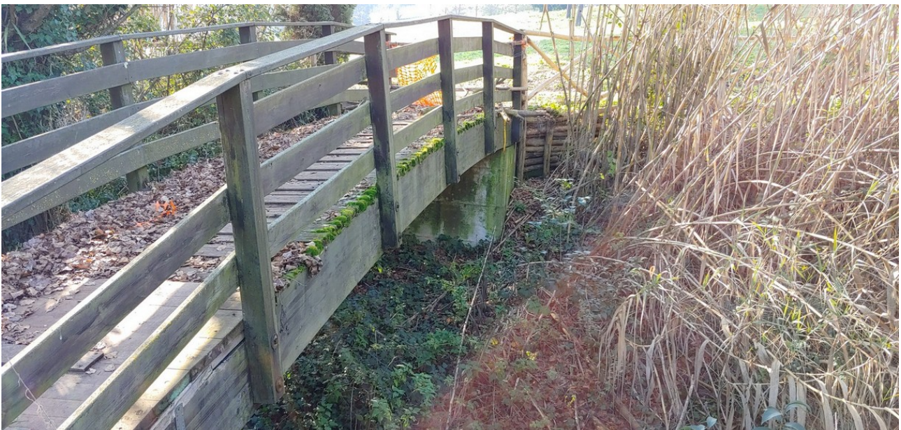
Ponte pedonale ante operam

Inoltre il ponte pedonale, che da progetto prevedeva la sola sostituzione dell'orditura secondaria, a seguito di verifiche dalla direzione lavori, è stato valutato la sostituzione integrale rendendosi necessaria la progettazione strutturale con presentazione e autorizzazione del Genio Civile.