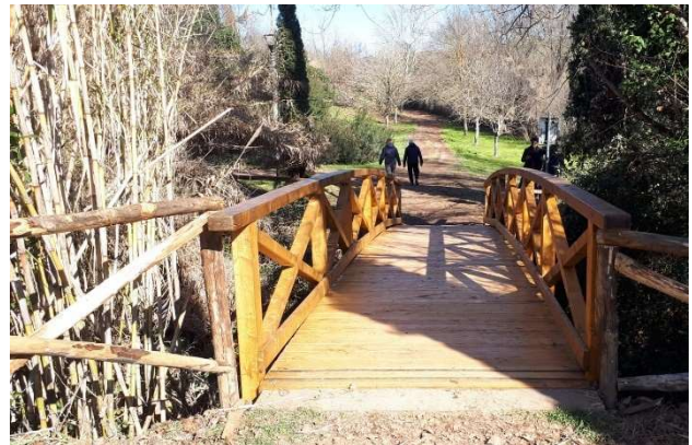
Ponte pedonale post-operam