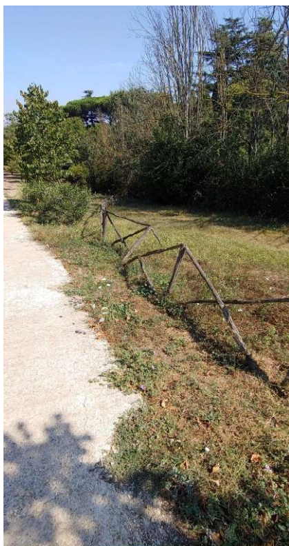
Staccionata a croce ante-operam