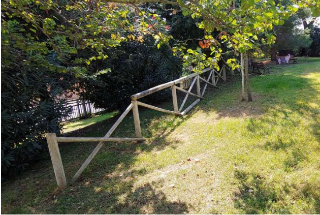
Staccionata a croce auto-clavata ante-operam