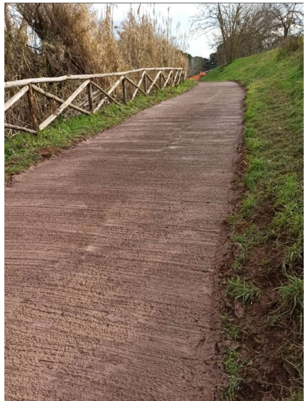
Viali in stabilizzato rinforzato post-operam