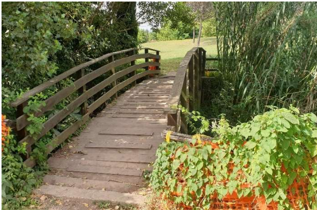
Ponte pedonale ante operam