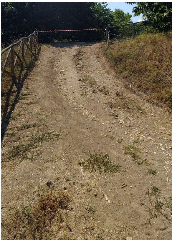
Viali in stabilizzato rinforzato ante-operam