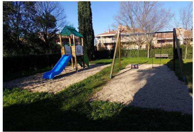
Area ludica post-operam