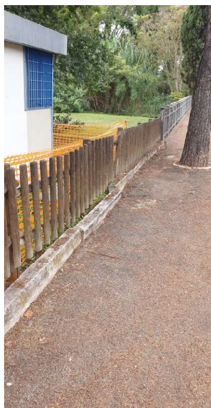
Staccionata a palizzata ante-operam