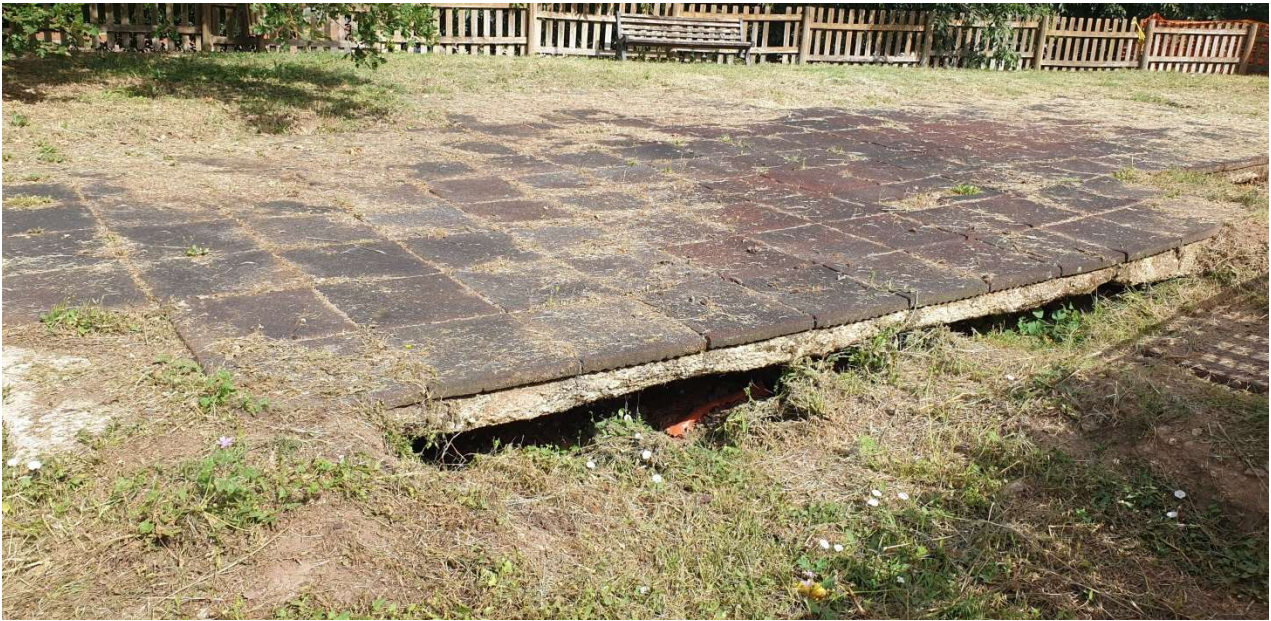
Area dissestata ante operam

Inoltre il ponte pedonale, che da progetto prevedeva la sola sostituzione dell'orditura secondaria, a seguito di verifiche dalla direzione lavori, è stato valutato la sostituzione integrale rendendosi necessaria la progettazione strutturale con presentazione e autorizzazione del Genio Civile.