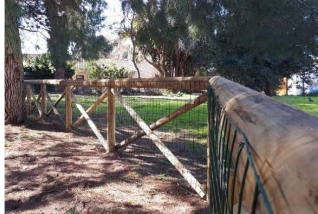
Staccionata a croce auto-clavata post-operam