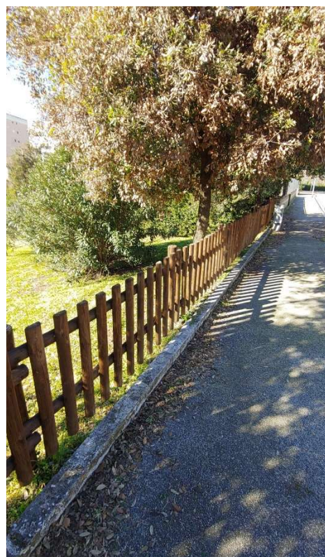
Staccionata a palizzata post-operam