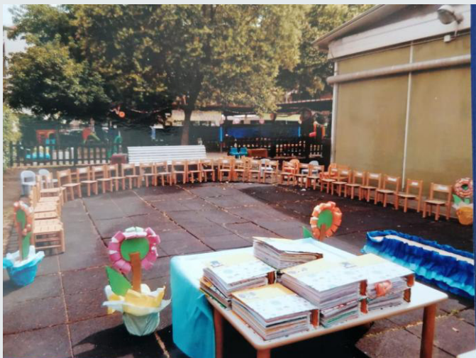
Festa di fine anno