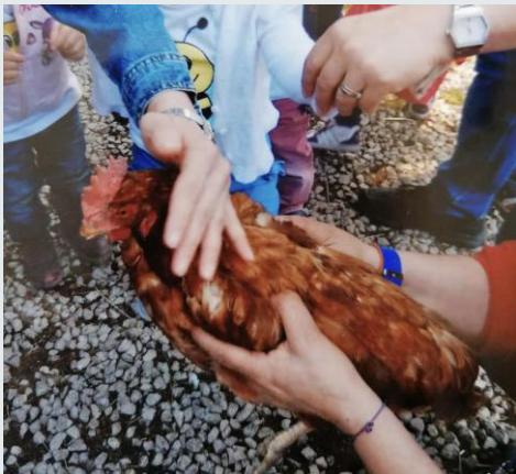
Gita alla fattoria