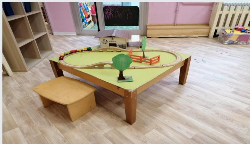
Centri di interesse