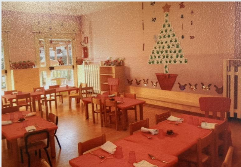
Festa di natale