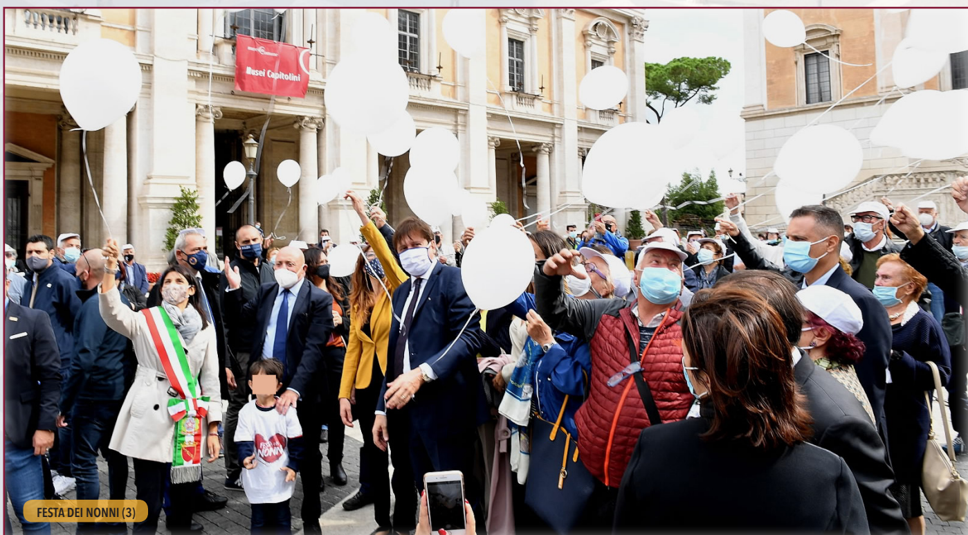
FESTA DEI NONNI (3)