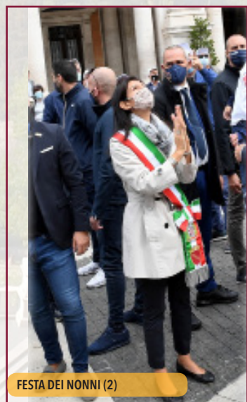
FESTA DEI NONNI (2)