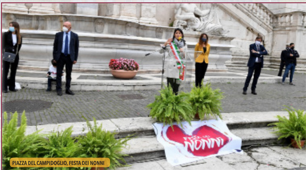
PIAZZA DEL CAMPIDOGLIO, FESTA DEI NONNI