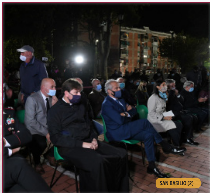
SAN BASILIO (2)