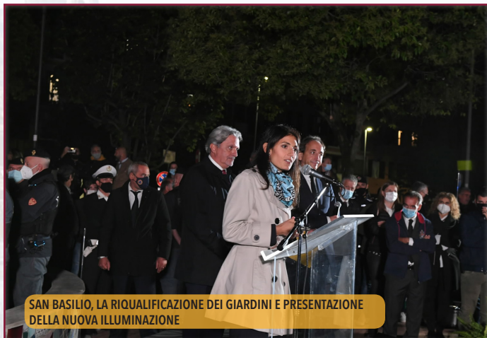
SAN BASILIO, LA RIQUALIFICAZIONE DEI GIARDINI E PRESENTAZIONE DELLA NUOVA ILLUMINAZIONE