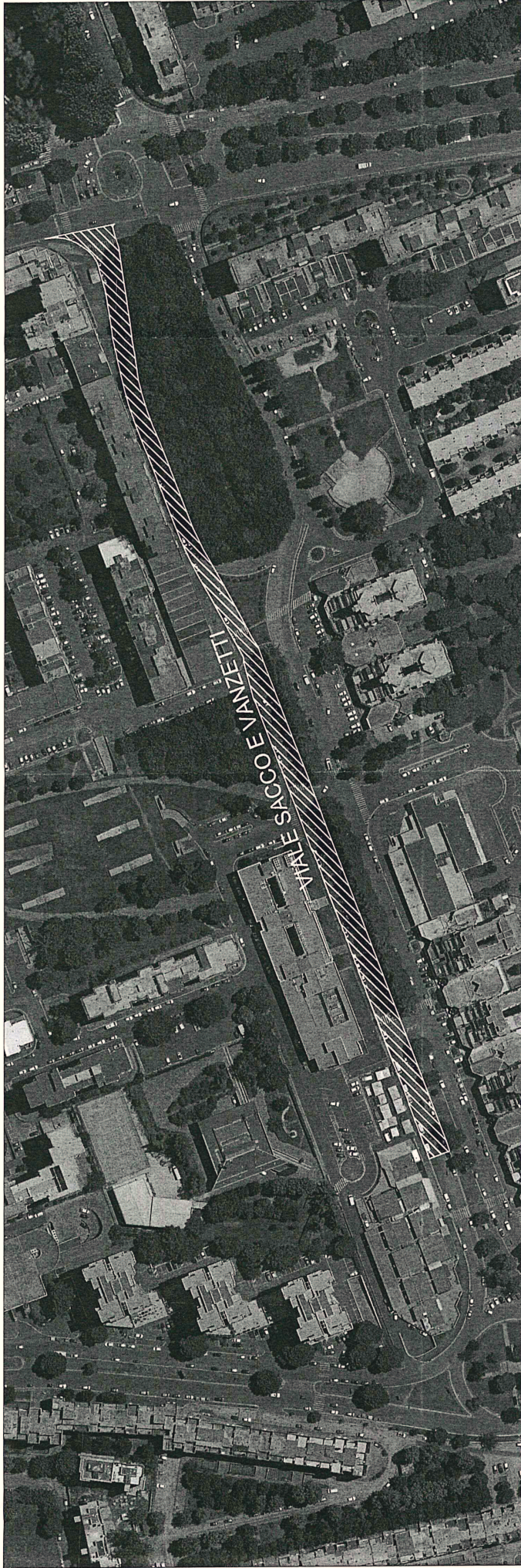
Planimetria catastale (Foglio n. 608 - Scala 1:2.000)