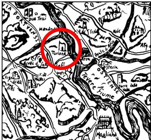
Eufrosino della Volpaia 1547. Particolare della mappa con indicazione del mausoleo "Turlone" (da Frutaz 1972)

Lungo la sponda destra del Tevere, raggiungibile da via delle Idrovore della Magliana, all'altezza dello stabilimento Pischiutta, sono i resti di un grande sepolcro romano. In origine il monumento era ricoperto da un rivestimento di blocchi di marmo e travertini che, come ricordano alcuni documenti di archivio, vennero asportati durante un periodo di almeno quattro anni, tra il 1461 e il 1465. Questo dato