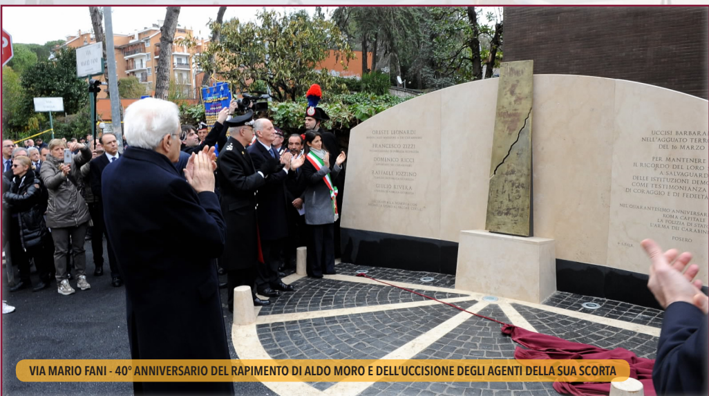
VIA MARIO FANI - 40° ANNIVERSARIO DEL RAPIMENTO DI ALDO MORO E DELL'UCCISIONE DEGLI AGENTI DELLA SUA SCORTA