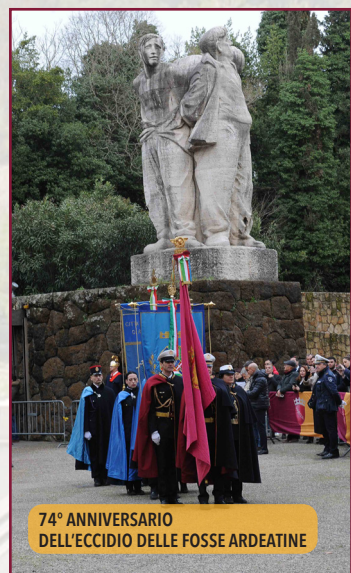
74° ANNIVERSARIO DELL'ECCIDIO DELLE FOSSE ARDEATINE