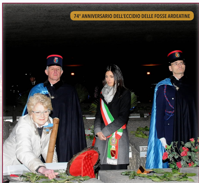
74° ANNIVERSARIO DELL'ECCIDIO DELLE FOSSE ARDEATINE