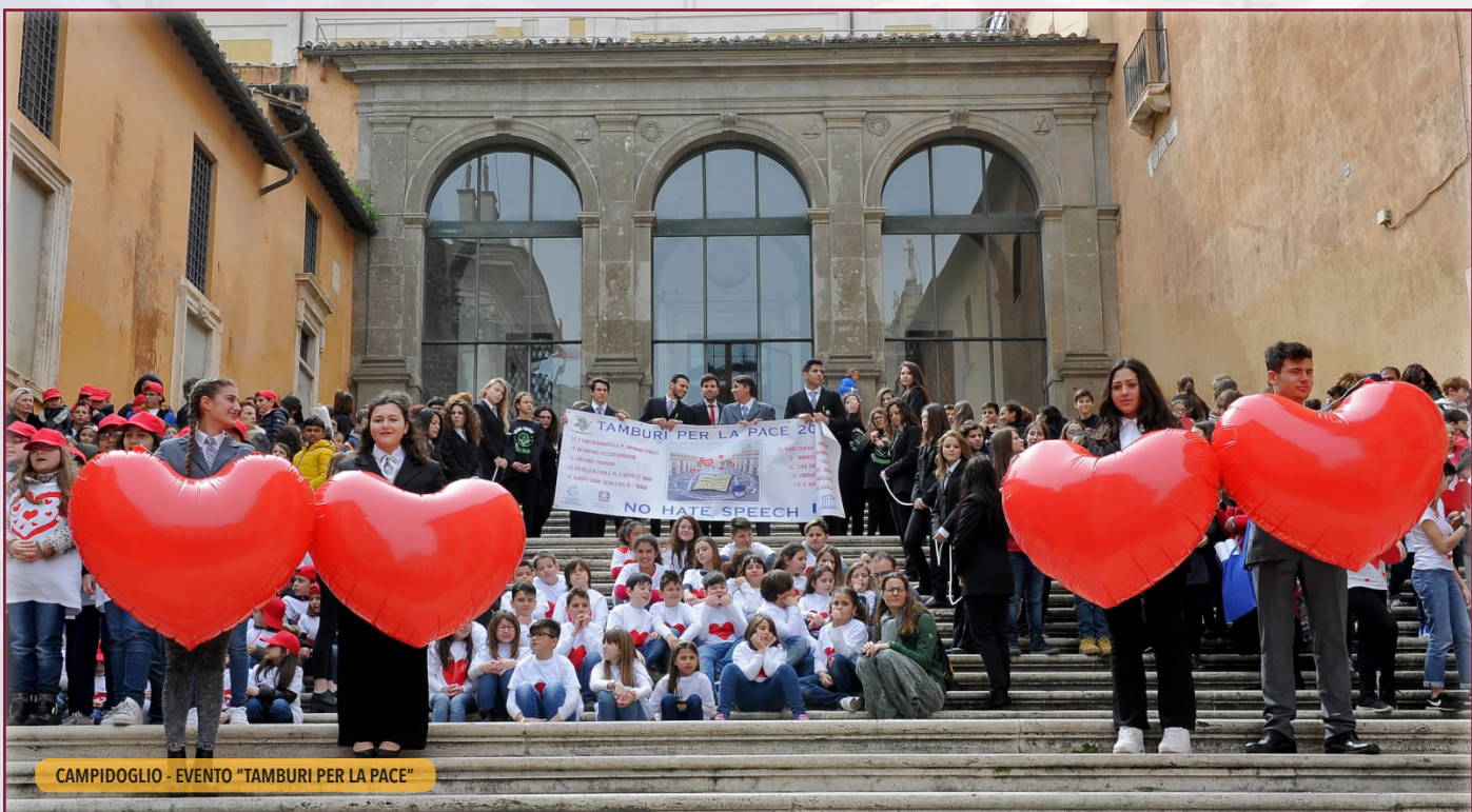
CAMPIDOGGIO - EVENTO "TAMBURI PER LA PACE"