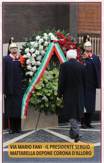
VIA MARIO FANI - IL PRESIDENTE SERGIO MATTARELLA DEPONE CORONA D'ALLORO