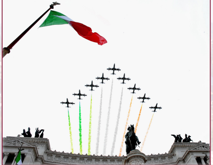
CELEBRAZIONI DEL 157° ANNIVERSARIO DELLA GIORNATA DELL'UNITÀ D'ITALIA