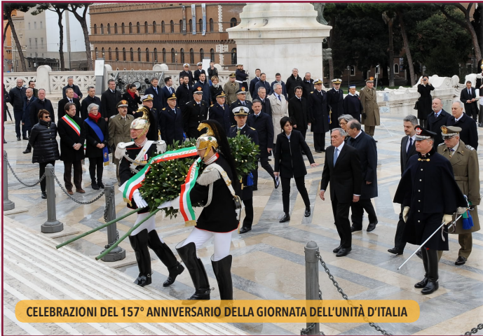
CELEBRAZIONI DEL 157° ANNIVERSARIO DELLA GIORNATA DELL'UNITÀ D'ITALIA