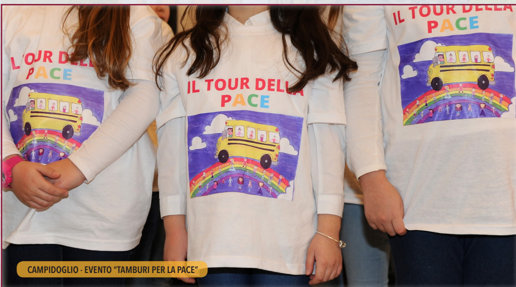
CAMPIDOGGIO - EVENTO "TAMBURI PER LA PACE"