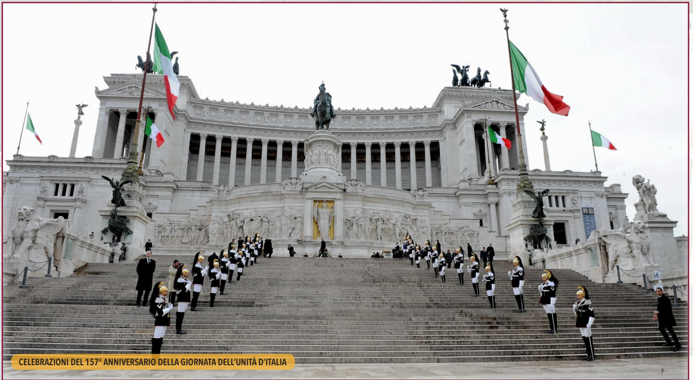
CELEBRAZIONI DEL 157° ANNIVERSARIO DELLA GIORNATA DELL'UNITÀ D'ITALIA