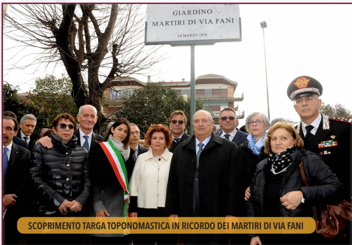
SCOPRIMENTO TARGA TOPONOMASTICA IN RICORDO DEI MARTIRI DI VIA FANI